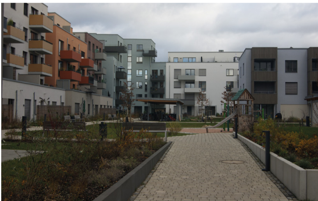
Bauprojekt mit hoher Sozialquote im Lagarde-Quartier: Lagarde-Höfe der Volksbau.