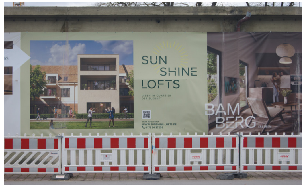
Hochpreisiges Bauprojekt im Lagarde-Quartier: Sunshine-Lofts.