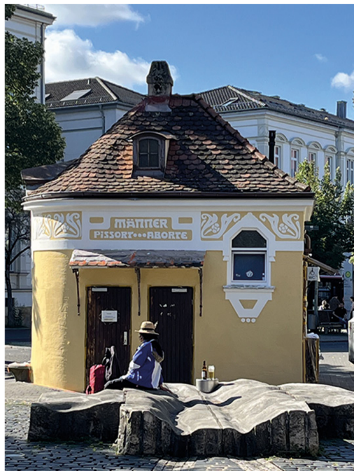
Öffentliche Toilette an der Promenade

* Die Namen wurden zum Schutz der betroffenen Personen verändert.